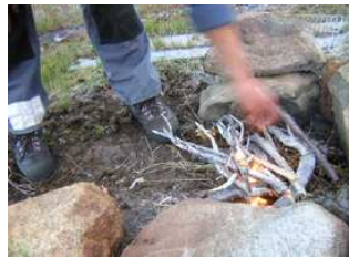
chaleur en plein air