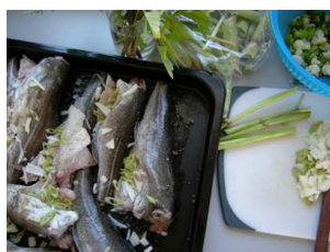
morues de l'Atlantique