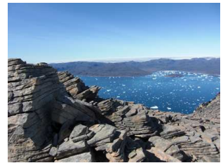
vue sur le fjord voisin

A Ipiutaq guest farm, vous pouvez découvrir l'agriculture et la nature sauvage du Groenland , partager notre table d'hôtes en découvrant une nouvelle cuisine , profiter des activités de plein air , telles que la pêche, la randonnée, le camping ou le travail à la ferme, ou bien vous détendre en admirant le paysage dans un cadre inhabituel et somptueux .