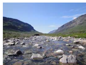
la rivière lua l'après-midi

Si vous aimez la pêche, vous pouvez pêcher des ombles de l'Arctique dans la rivière Ilua (située à une heure de marche), l'un des meilleurs lieux de pêche au Groenland . Dans le fjord juste en contrebas de notre maison, vous pouvez aussi pêcher des morues ogac ou de l'Atlantique. Agathe se fera un plaisir de les cuisiner simplement en papillote aux algues et herbes sauvages ou bien elle élaborera pour vous sa « bouillabaisse groenlandaise ».