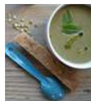
soupe à l'oseille