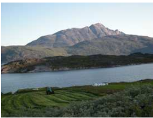
la moisson à Ipiutaq

Située le long du fjord principal reliant Narsarsuaq - l'aéroport international du Sud du pays - aux villes de Narsaq puis Qaqortoq, Ipiutaq guest farm offre une grande diversité de paysages , des hauts pics enneigés, torrents et chutes d'eau aux longues plages rocheuses et verts pâturages.