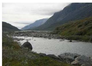
vallée et rivière Ilua