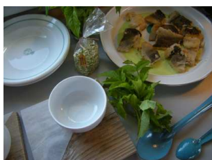
cuisiner le poisson...