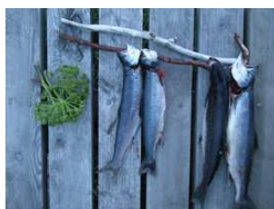
ombles de l'Arctique