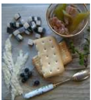
peau de baleine

Une cuisine raffinée et originale : des produits locaux revisités par la tradition française