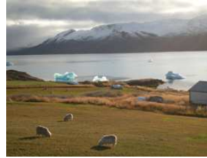
glaces et moutons