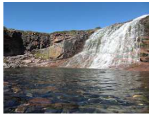
au pied d'une chute d'eau